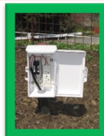
電源コンセント有