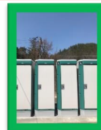
男女兼用 洋式トイレ